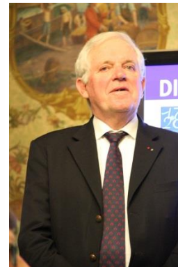
J.P Dellenbach PAST GOUVERNEUR