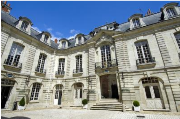
6 Mars 2015 – CCI TOURAINE - 4rue Jules Favre -37000 Tours