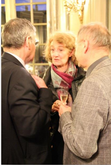
Sophie AUCONIE ancienne député européenne